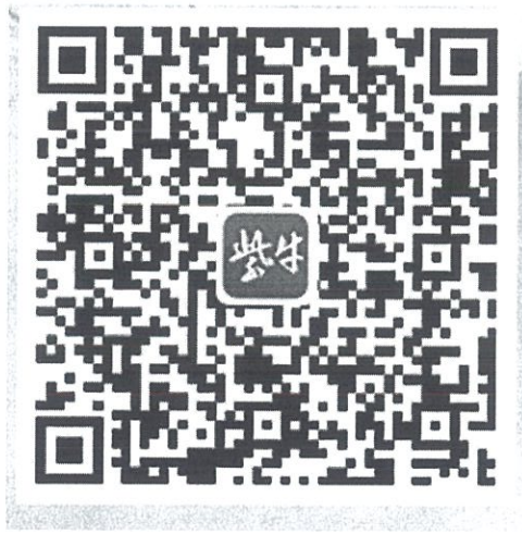
《共富争先·微故事》系列融媒报道二维码