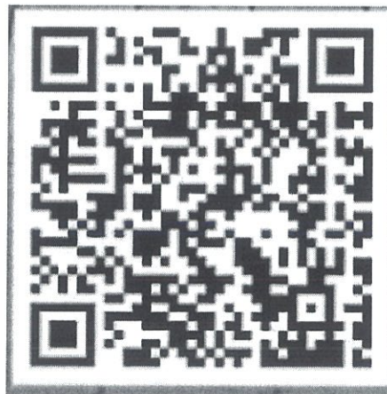
“共富争先·微故事” 3D 展馆二维码