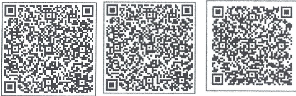
《“共富争先·微故事”系列融媒报道》代表作 1、代表作 2、代表作 3 二维码